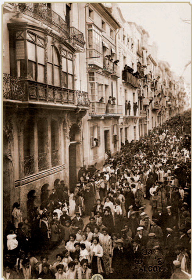
Manifestación de las Cigarreras / E. García 1908. Fuente: Historia de Alcoy